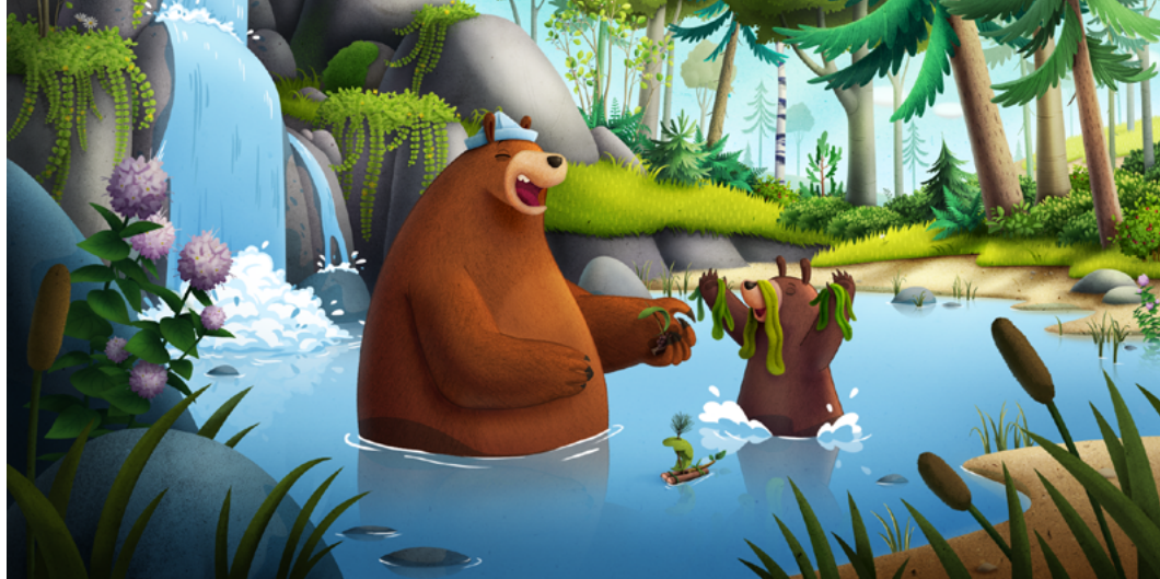
Przytul mnie. Poszukiwacze miodu