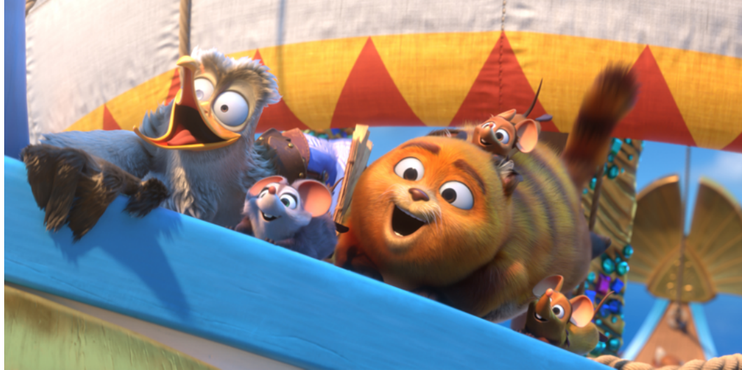
Pati i kłątwa Posejdona