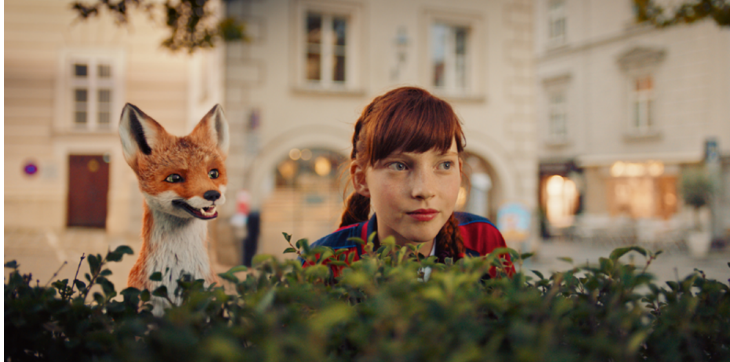
Szkoła magicznych zwierząt