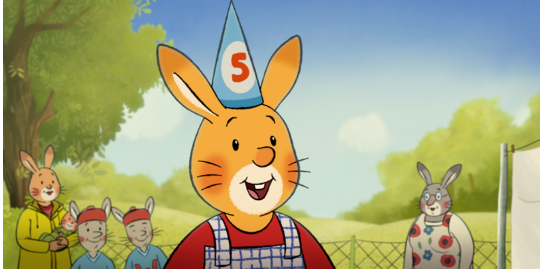
Najlepsze urodziny Królika Karola