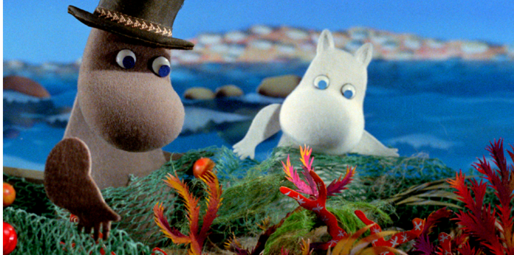
Pamiętniki Tatusia Muminka