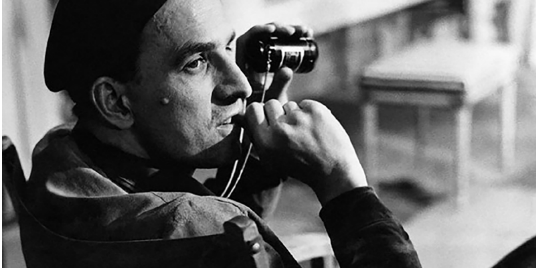
Bergman – rok z życia