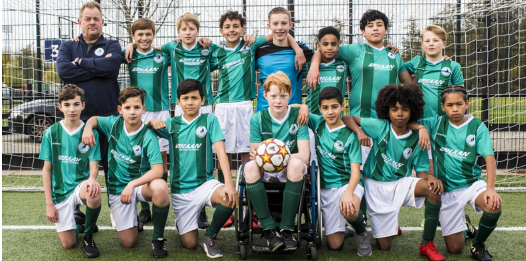
Mecz o wszystko