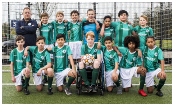
Mecz o wszystko