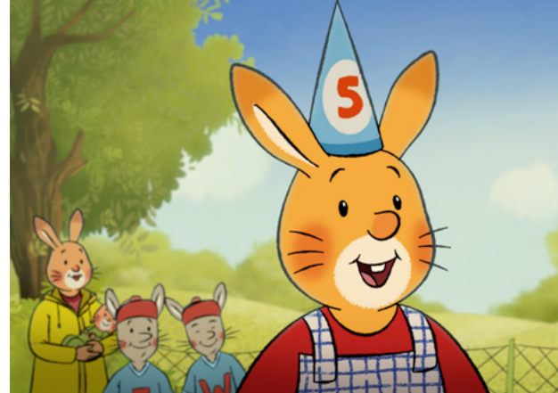
Najlepsze urodziny Królika Karola