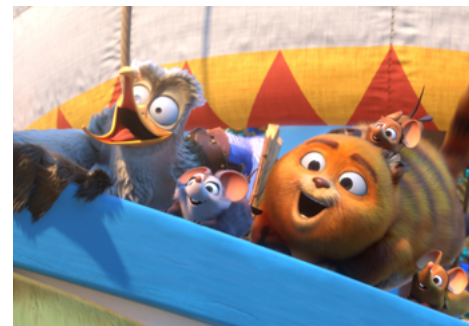
Pati i klątwa Posejdona