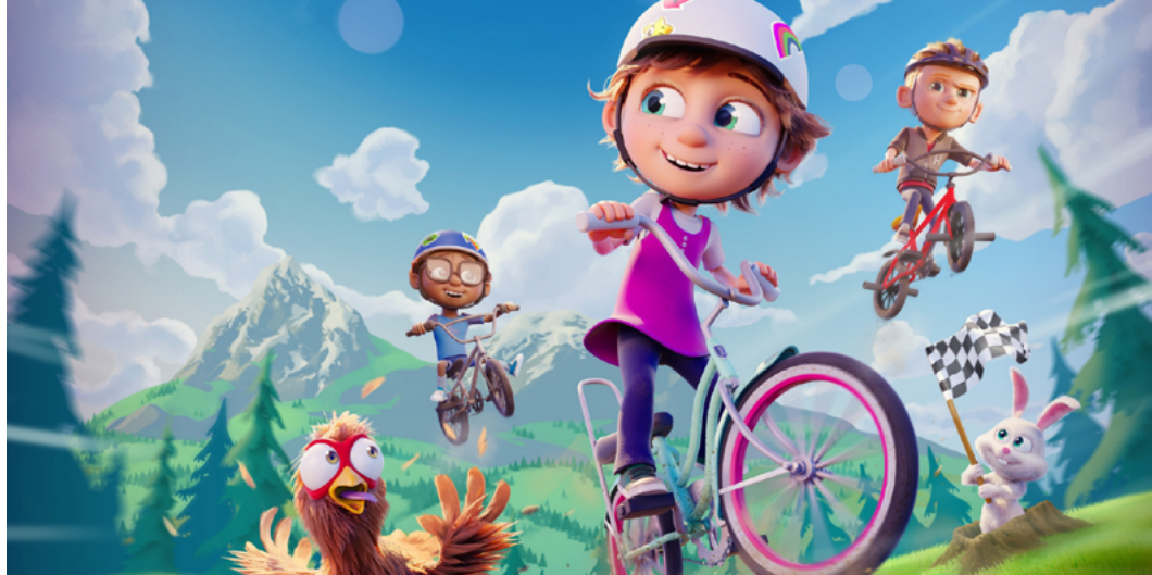
Ella Bella Bingo