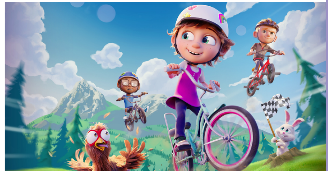
Ella Bella Bingo