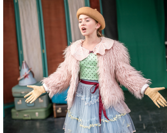
Moje życie to cyrk